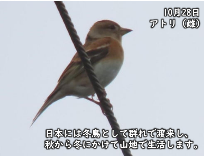
10月28日 アトリ (雌)