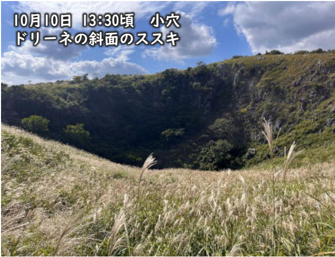
10月10日 13:30頃 小穴 ドリーネの斜面のススキ

10月22日頃、ジョウビタキの初鳴きが確認されました。シロハラの声もあちらこちらで聞かれ、アトリの群れも渡来しています。