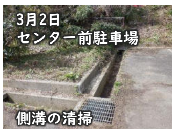
3月2日 センター前駐車場 側溝の清掃

3月のボランティア活動はゴミ拾いを中心に行いました。4回の活動、延べ人数44名のボランティアで合計43袋ものゴミを拾いました。このうち、3月16日(土)『第24回クリーン大作戦』は、例年、企業・団体・地域の方にもご参加いただいておりますが、今年度は休館中のため、登録ボランティアのみで行いました。