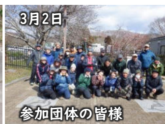
3月2日 参加団体の皆様