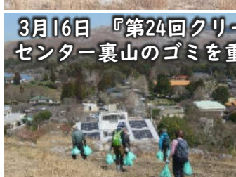
3月16日 『第24回クリーン大作戦』 センター裏山のゴミを重点的に拾いました。