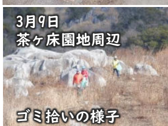
3月9日 茶ヶ床園地周辺 ゴミ拾いの様子