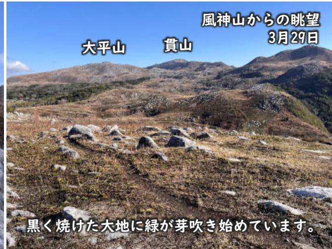
風神山からの眺望 3月29日