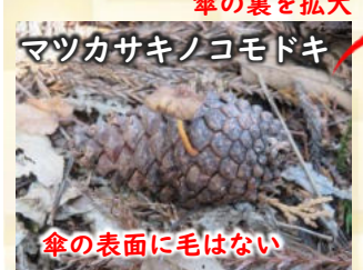
マツカサキノコモドキ