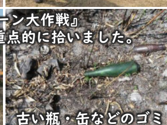
古い瓶・缶などのゴミ

上記センターの活動以外にも、登山などで訪れた方々が思い思いにゴミ拾いをされています。クリーンアップにご協力いただきありがとうございます。