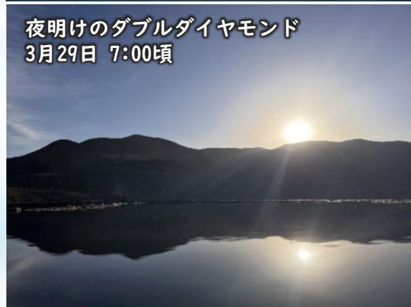
夜明けのダブルダイヤモンド 3月29日 7:00頃