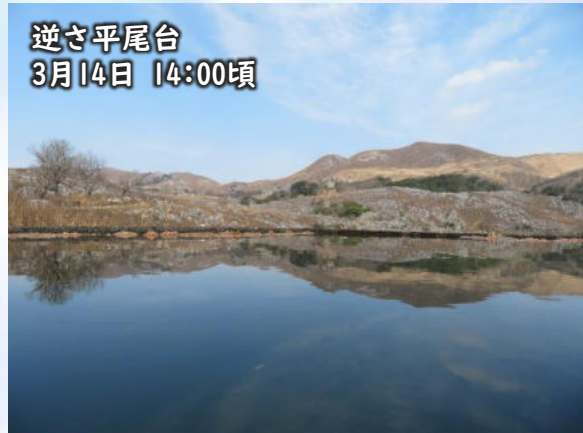
逆さ平尾台 3月14日 14:00頃

まるでカルスト湖が出現したかのような写真が撮れるスポット。撮影場所を見つけ出して水面に映る幻想的な光景を撮影してみては?