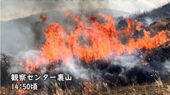
観察センター裏山 14:50頃

午後の部は、14:40頃に火入れが始まりました。観察センター裏山でも、パチパチと音を立てながら、瞬く間に炎が駆け巡りました。