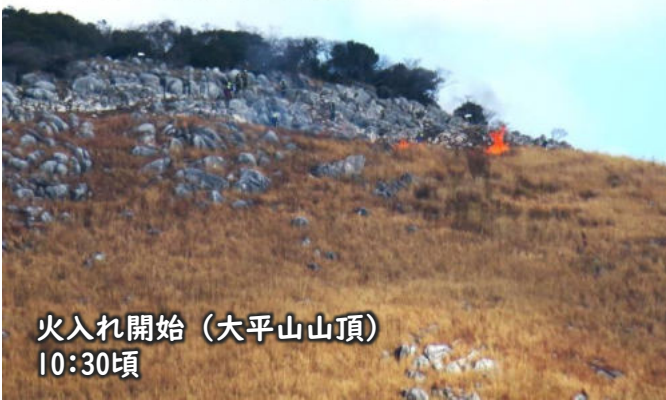
火入れ開始 (大平山山頂) 10:30頃