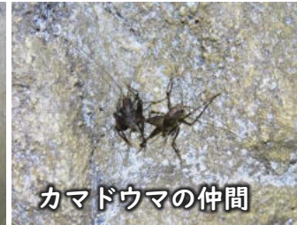
カマドウマの仲間